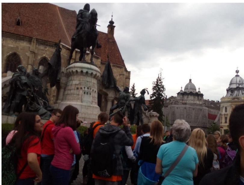
Kolozsvár 2019. május 27.

A Székelyfonó hallgatása és a vers olvasása közben eszembe jutottak a tavalyi élményeim. 2019-ben évfolyamtársaimmal és tanárainkkal a „Határtalanul!” pályázat keretében az 1848-49-es forradalom és szabadságharc nyomába eredtünk Erdélyben.