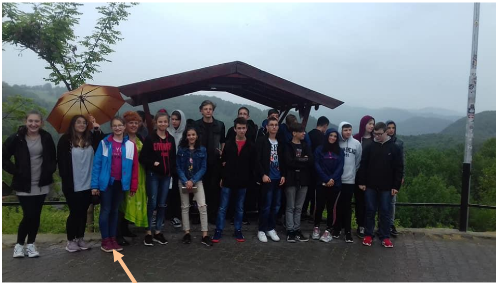
Királyhágó 2019. május 27.

Kodály a népzene keresztül juttatta el hozzánk az erdélyi hangulatot. A művet daljátéknak tekintjük, bár ez nem teljesen igaz. Nincsenek benne prózai részek és nincsen egybefüggő történet sem, csak életképek sorozatából áll. 1932. április 24-én adták elő először. Kodály Zoltán új műfajt teremtett, az egyfelvonásos zenedrámát.