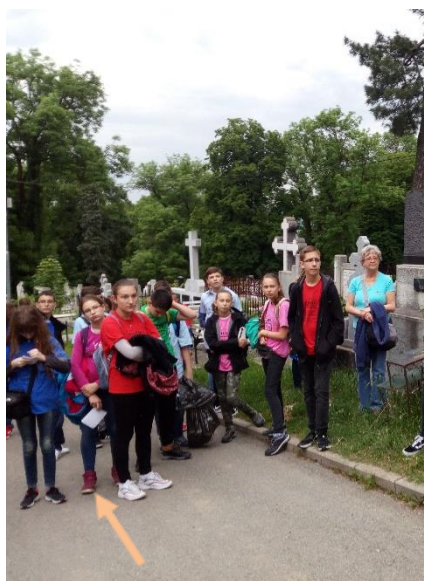
Házsongárdi temetőben 2019. május

A nap utolsó állomása a Házsongárdi temető volt. A szemerkélő eső, a borús ég, a sötétedés ellenére bátran másztuk meg a meredek dombon fekvő, Európa legrégebbi még ma is működő temetőjét. Megkoszorúztuk Bethlen Gergely, Koós Károly, Apáczai Csere János sírját és a Dsida sírboltot. Ezután már csak a finom vacsora és a szállásra érkezés és a jól megérdemelt pihenés volt hátra. Na meg a naplórás