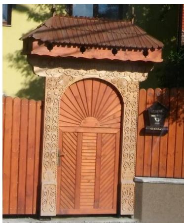
Zetelaka-székelykapu 2019. május 29.