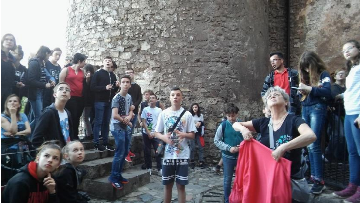
Vajdahunyad vára