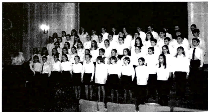
Az Év Kórusa, 1999